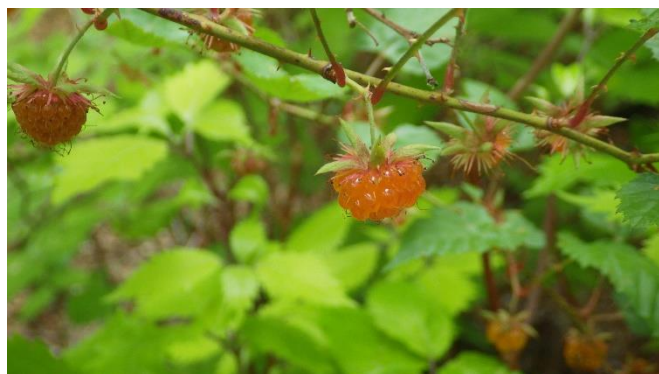
ナガバモミジイチゴ

昨年はナガバモミジイチゴの実が豊富で、ジャムが作れるほどでしたが、今年は不作です。林道沿い右手のナガバモミジイチゴが、かなり刈り払われていました。植林管理上仕方ありませんね。ヤマイバラの木が1株あり新発見でした。