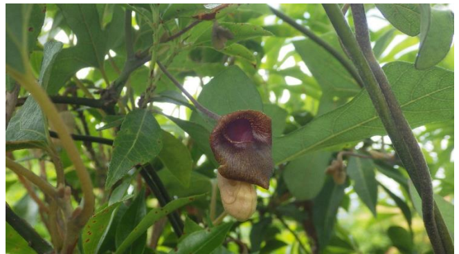
オオバウマノスズクサの花

珍しいオオバウマノスズクサの花が、木陰のベンチ傍の木に絡みついて咲いています。上深川縦走を始めると、早くもコアジサイが咲いています。今年も花が見事です。林道沿いはコガクウツギ、ウツギ、ヤマイバラ、クマイチゴ、ナガバモミジイチゴなどが混じって続きます。なんととってもコアジサイの群生は見事です。